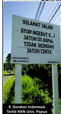
9. Gerakan Indonesia Tertib KKN Univ. Papua

Sosialisasi Ketertiban pada pengguna jalan raya