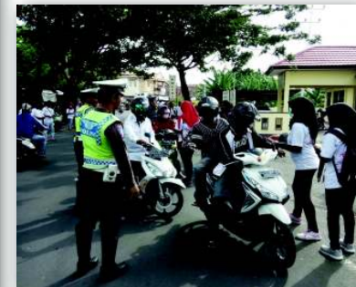
10. Gerakan Indonesia Tertib KKN Univ. Khairun