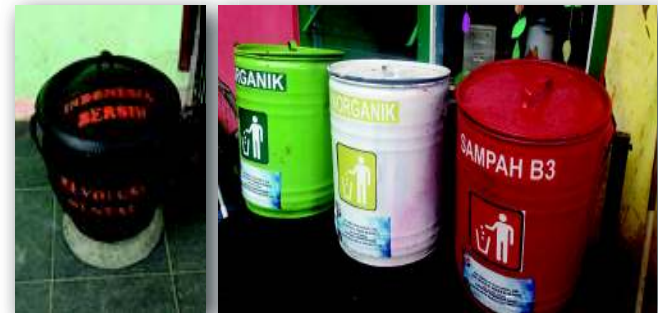
3. Gerakan Indonesia Bersih KKN Universitas Bangka Belitung