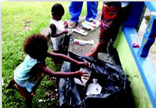
5. Gerakan Indonesia Bersih KKN Univ. Papua

Edukasi perilaku hidup bersih dan sehat pada anak-anak