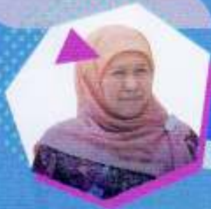
DRA. H.J. KHOFIFAH INDAR PARAWANSA, M.SI. Gubernur Jawa Timur (Terpilih)