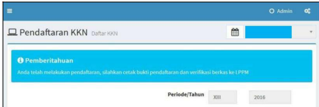
Screenshoot Kolom Pemberitahuan

Maka proses verifikasi belum dilakukan oleh LPPM UNUD. Apabila Mahasiswa Peserta sudah melakukan Verifikasi Berkas KKN PPM ke LPPM UNUD, dan Kolom Pemberitahuan masih seperti tersebut diatas, maka dimohon kepada mahasiswa bersangkutan untuk segera melapor ke LPPM UNUD, dengan membawa berkas yang sudah di tandatangan dan di cap oleh petugas Verifikasi KKN PPM, paling lambat hari Senin tanggal 29 Mei 2017 Pk 16.00 Wita. Hal tersebut terjadi, dimungkinkan Sistem SIM KKN di IMISSU mengalami gangguan pada saat proses verifikasi.